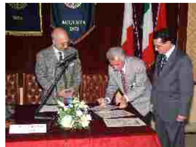
"Gemellaggio Internazionale con RC Ankara Bahçelievler" Augusta, 14 Novembre 2004