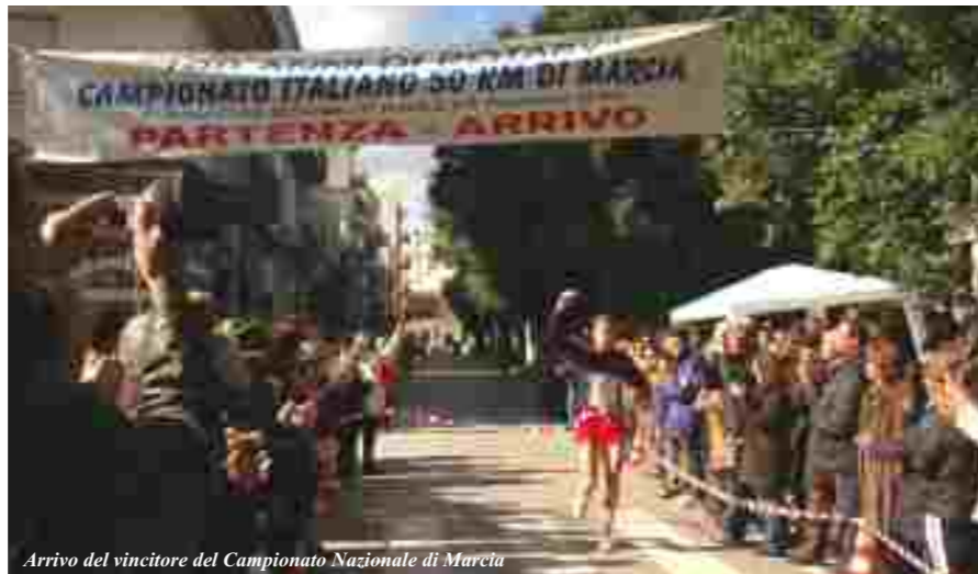
Arrivo del vincitore del Campionato Nazionale di Marcia

E' stata una emozione poterli intervistare nel corso del prestigioso Convegno che si è tenuto sabato 29 Gennaio a Palazzo S. Biagio, e poi poterli premiare al termine della gara che ha visto vincitore in campo maschile una giovane